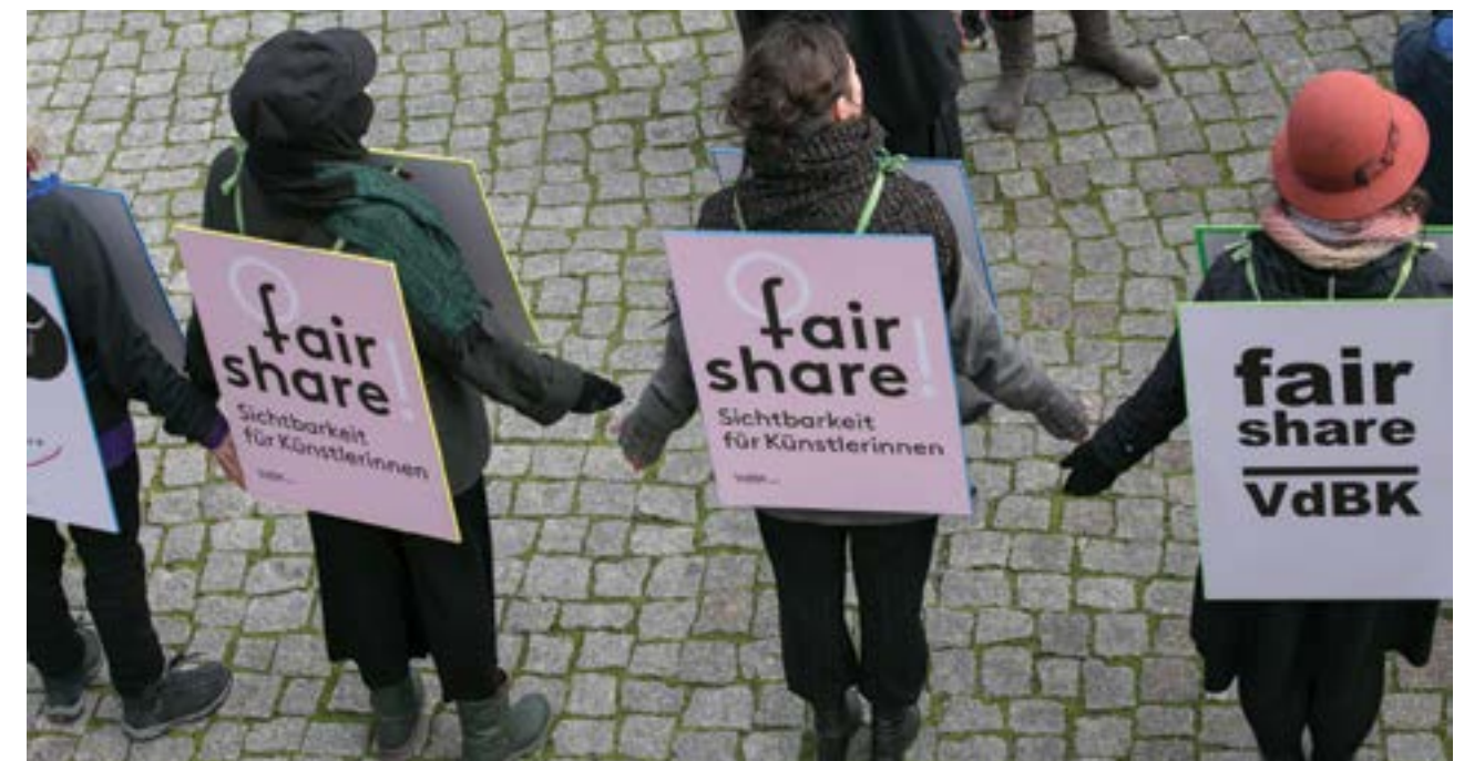
Aktion des VdbK 1867 zum 8. März