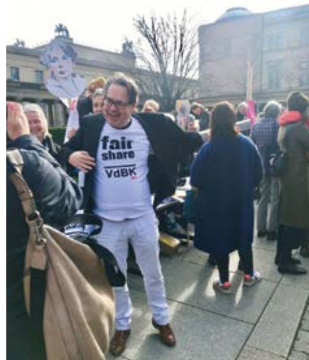
Udo Kittelmann, Leiter der Nationalgalerie Berlin

Die vorliegende Broschüre dokumentiert die reiche Ausbeute engagierter Stimmen für eine faire Beteiligung von Künstlerinnen im Kunstbetrieb – die, einige Monate nach dem Corona-Lockdown, dringlicher denn je geworden ist. Viele der auch vor den drastischen Beschränkungen prekär lebenden Kunst-