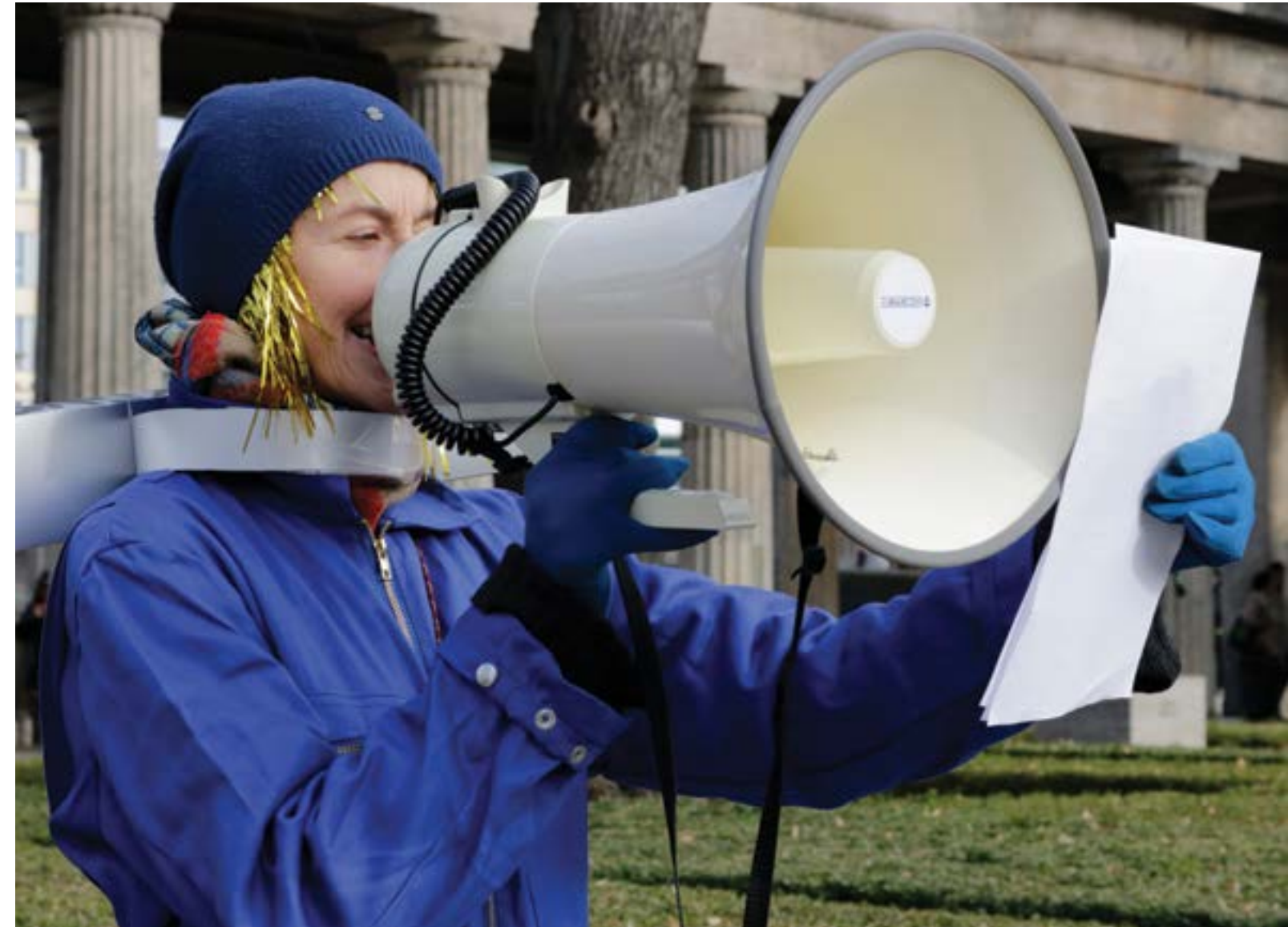
Fortsetzung folgt ...! © Ivana Papic