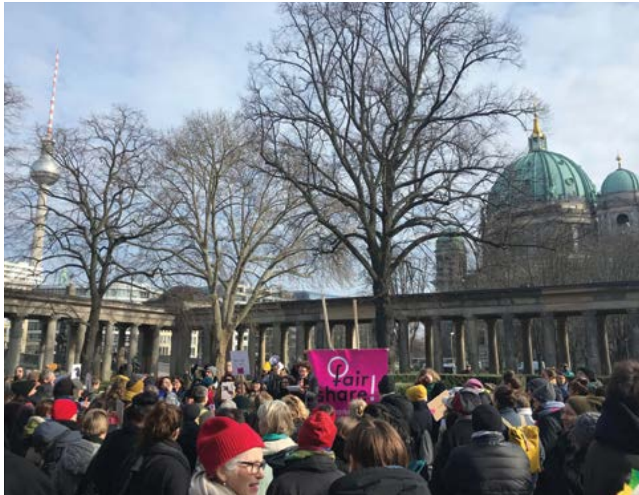
fair share! Demonstration am 8. März 2020

Am 8. März 2020, dem Weltfrauentag, fand die Demonstration „fair share! Sichtbarkeit für Künstlerinnen!“ statt. Anlass war der letzte Tag der Ausstellung „Kampf um Sichtbarkeit – Künstlerinnen der Nationalgalerie vor 1919“ in der Alten Nationalgalerie in Berlin. Zum ersten Mal wurden hier alle in der Sammlung der Nationalgalerie vertretenen Künstlerinnen bis 1919 mit einem oder mehreren Werken vorgestellt. Wie die Ausstellung „KLASSE DAMEN! 100 Jahre Öffnung der Berliner Kunstakademie für Frauen“ im Schloss Biesdorf im Sommer 2019, „feierte“ auch die Alte Nationalgalerie Künstlerinnen, die vor 100 und mehr Jahren für eine Zulassung zum Kunststudium kämpften und mit ihren Werken beachtliche Erfolge in der durch und durch männlich geprägten Kunstwelt erzielten.