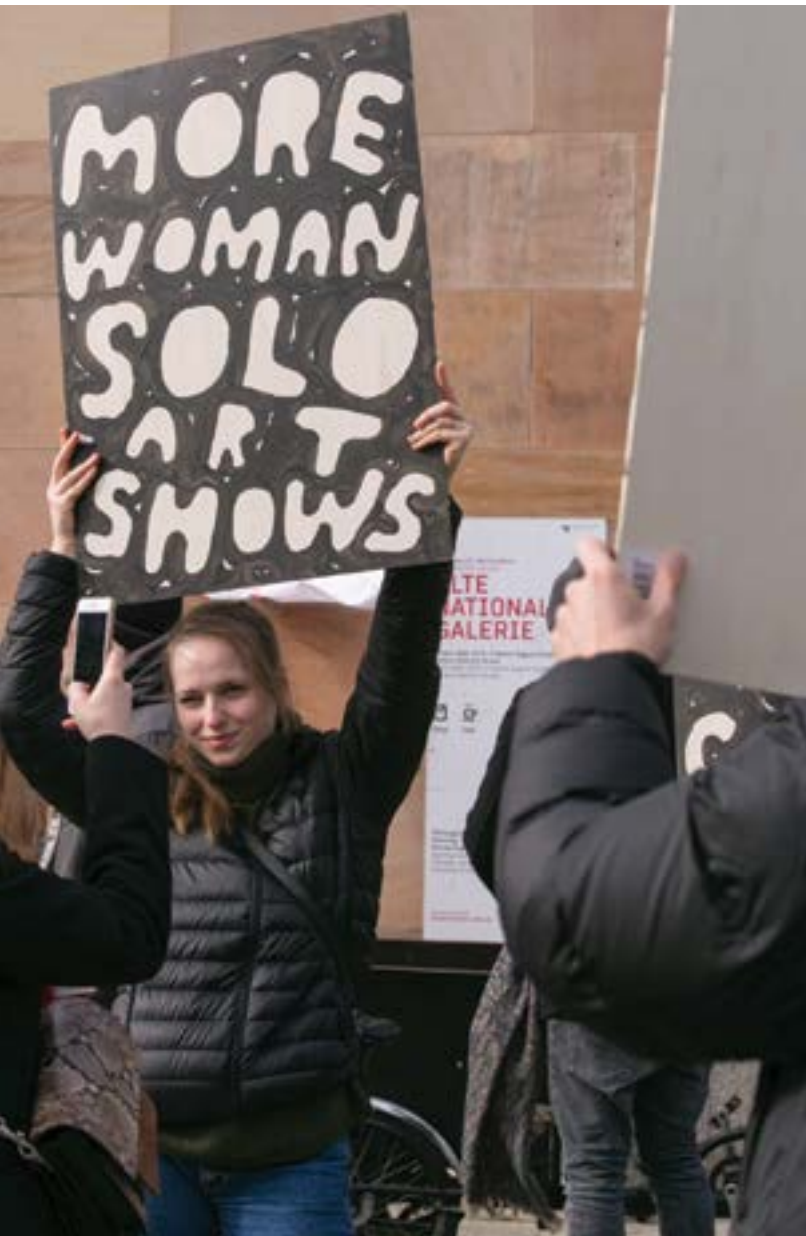
More women solo art shows! © Elfi Greb

Geben Sie das Mysterium des Künstlertums dahin zurück, wohin es gehört – zum Werk.