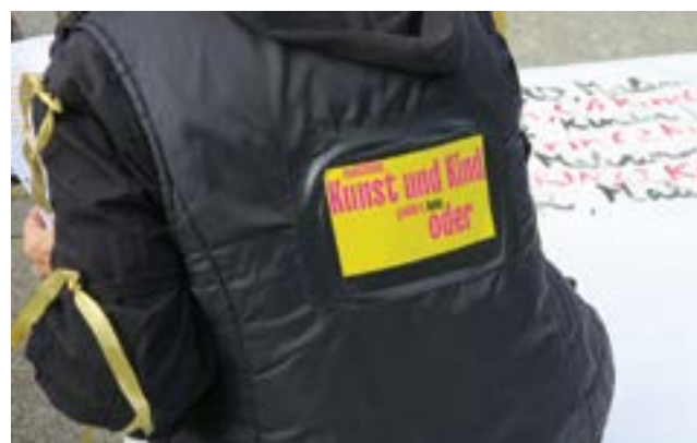
Zwischen KUNST und KIND gehört kein ODER © Susanne Jäger

Basierend auf der Idee von kunst + kind berlin, Namen (vergessener) Künstlerinnen mit Kind seit der Renaissance auf ein Banner zu schreiben, haben Vertreterinnen von kunst + kind berlin und der GEDOK Berlin für die „fair share! Sichtbarkeit für Künstlerinnen“-Demo folgende Aktion entwickelt und durchgeführt: