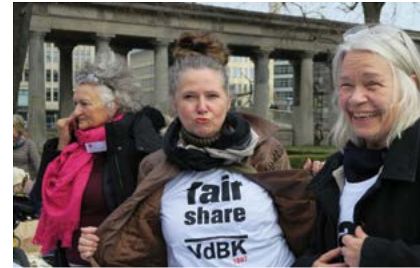
Demonstrantinnen des VdBK

Obwohl kostbare Werke von Künstlerinnen in den Depots lagern und immer wieder Initiativen wie das Ausstellungs- und Forschungsprojekt „Profession ohne Tradition“ von 1992 auf das Problem aufmerksam machen, zeigte und zeigt der öffentlich subventionierte Kulturbetrieb wenig Interesse daran, die Lücken aufzuarbeiten und die Wände und