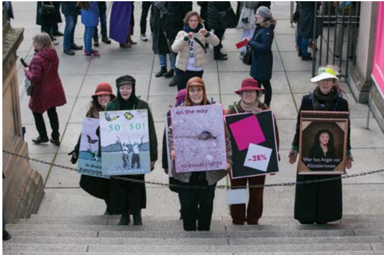
Aktion des VdBK 1867

men könnten? Wie wäre es außerdem, wenn wir bei Stipendien die Altersgrenzen abschaffen, denn diese sind absolut nicht mehr zeitgemäß, denkt man an späte Studierende oder eben an Ausfälle durch Erziehungszeiten.