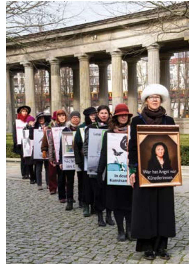
Aktion des VdbK 1867 zum 8. März

Die Performance wiederholte sich in einem bestimmten Rhythmus über die gesamte Laufzeit der fair share! Demonstration.