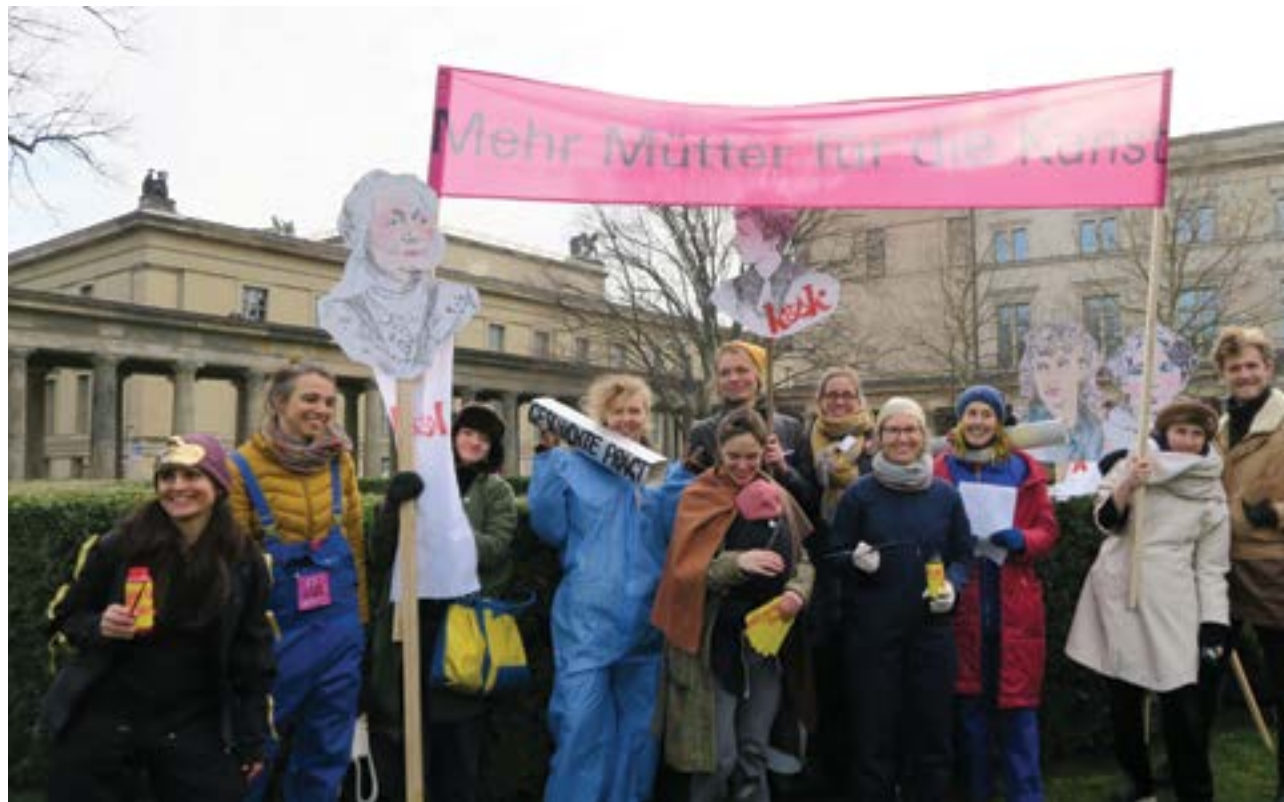
kunst + kind berlin

interessieren. Ein Jour fixe an jedem zweiten Donnerstag im Monat (ausgenommen Berliner Schulferien) dient der Netzwerkbildung und dem persönlichen oder fachlichen Austausch; kunst + kind berlin lädt überdies wechselnde Gäste aus dem Berliner Kunstbetrieb ein, um mit ihnen über best practice-Ansätze und geschlechtergerechte Maßnahmen zu diskutieren.