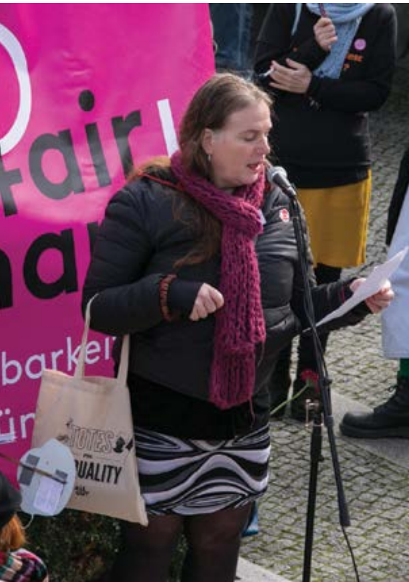
Yishay Garbasz

Mein ganzes Leben hieß es: „Wenn du talentiert bist und dich anstrengst, kannst du eine erfolgreiche Künstlerin werden.“